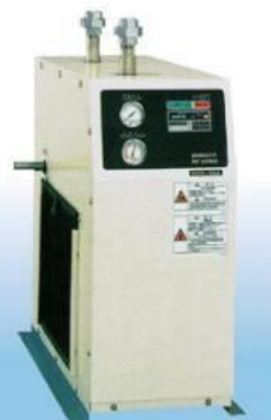
HDR - 55A

เครื่องกำจัดความชื้น สำหรับกำจัดน้ำในระบบท่อลมอัด ที่เหมาะสมกับบีมลมแต่ละรุ่น แต่ละขนาดเอาไว้อใช้งานร่วมกับเครื่อง Air Compressor (บีมลม)