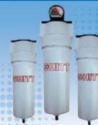
ชุดกรองอากาศ