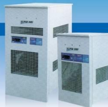
เครื่องกำจัดความชื้น

Correction factors "f" for differential working pressure